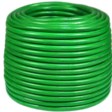
MANGUEIRA TOPFLEX Suporta até 8 kgf/cm 2 . Produzidas em PVC extra-flexível e reforçada com fios de poliéster trançados e paralelos.