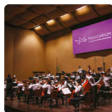
Musicarium Academia Filarmônica Brasileira