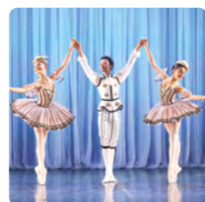
Teatro Bolshoi Escola do Teatro Bolshoi