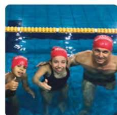
APJ - Associação Paralímpica de Joinville (Natação)

O Grupo Krona tem um compromisso com a comunidade. Por meio de projetos sociais e esportivos, impactamos positivamente milhares de vidas. Investimos em inclusão e responsabilidade social, além de apoiarmos ações sociais e instituições beneficentes.