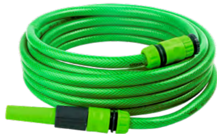
ACOMPANHA: · 1 Adaptador de torneira · 2 Engates rápidos · 1 Esguicho