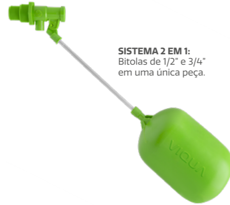
SISTEMA 2 EM 1: Bitolas de 1/2" e 3/4" em uma única peça.